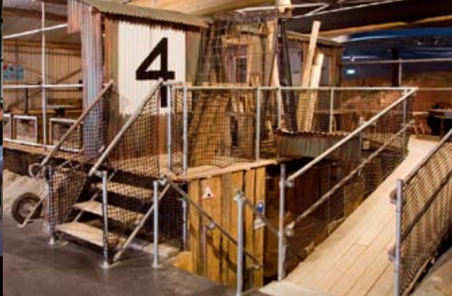
foto links: Begrafenisritueel tijdens gezondheidsweekeind Archeon, mede georganiseerd door SGGU. midden: Festival Gezondheid 2005. rechts: "Ondergronds" in Nieuw Land Erfgoedcentrum, Lelystad, waar kinderen zelf relictten uit het verleden kunnen opgraven en boven in het laboratorium kunnen interpreteren en dateren. onder: Interface van de Archeotalk-applicatie voor de gemeente Thorn.